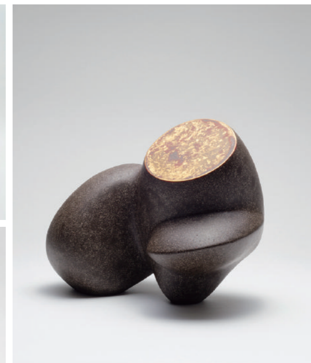
左上：《我也是》 左下 / 右：《空置的思想》系列

测试颜色和可操作性。我做了一个卵形的结构，它是我所有作品的基础。这次我离开了卵形，并尝试敞开，我给了它一个前足，从某种意义上讲我赋予了卵形一些新的态度和个性。