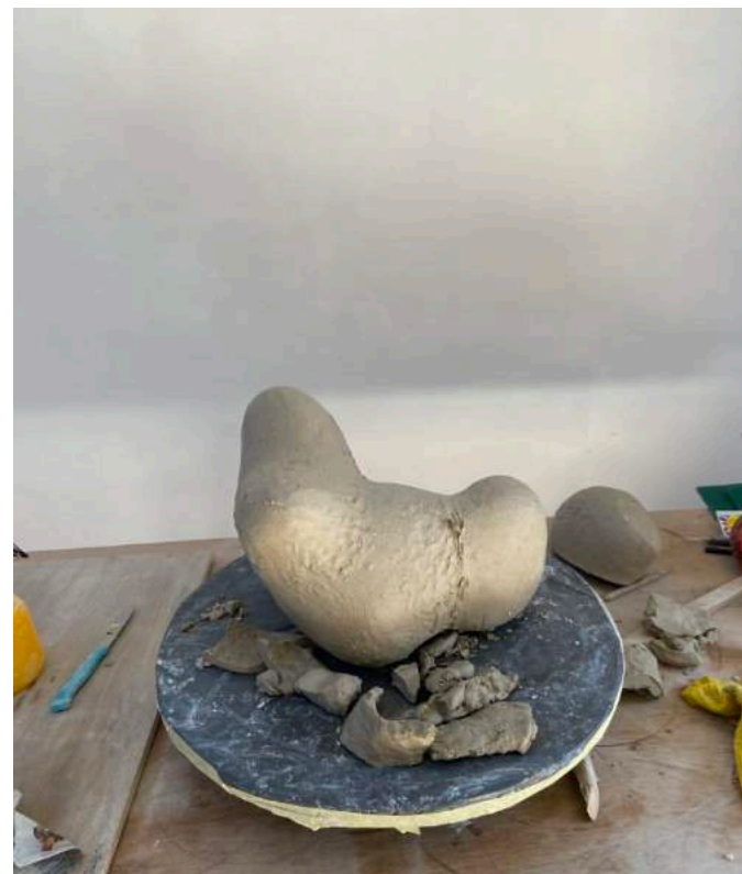
11.03 in de ochtend.