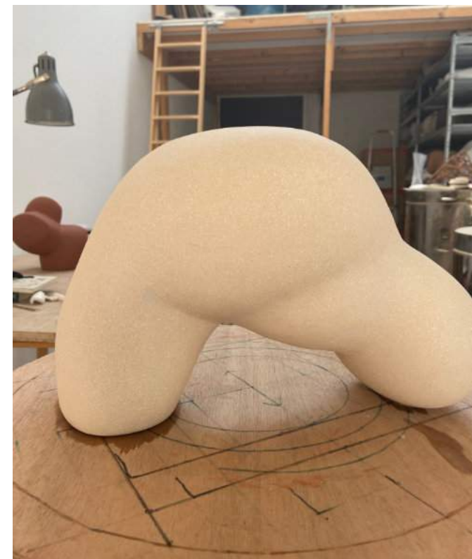
Na de biscuitstook schuur en polijst ik het werk, dan breng ik porseleinslib (met een smeltmiddel) aan en stook tot steengoedtemperatuur.