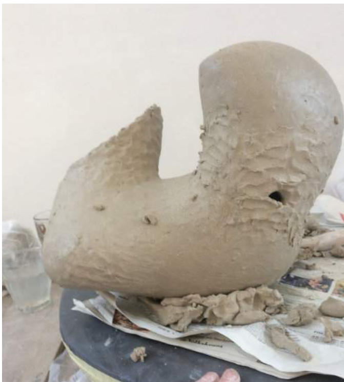
Nog altijd ben ik op zoek naar een meer hoekige vorm...