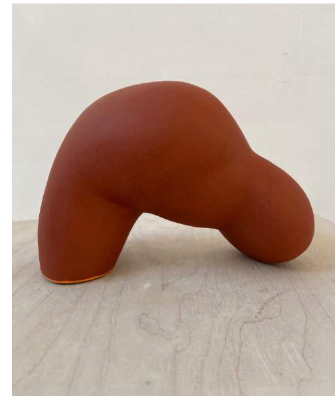
Daarna breng ik verschillende lagen stain (met een smeltmiddel) aan en stook nogmaals, nu op een gemiddelde temperatuur. Totdat de huid voldoende diepte in de kleur heeft verkregen. In dit geval waren het twee stoken. Het eindresultaat: Red Rover , steengoed, 135 cm.