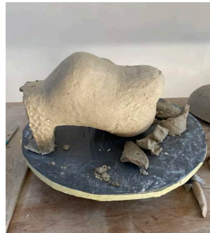
59 seconden later – vanuit een ander gezichtspunt.