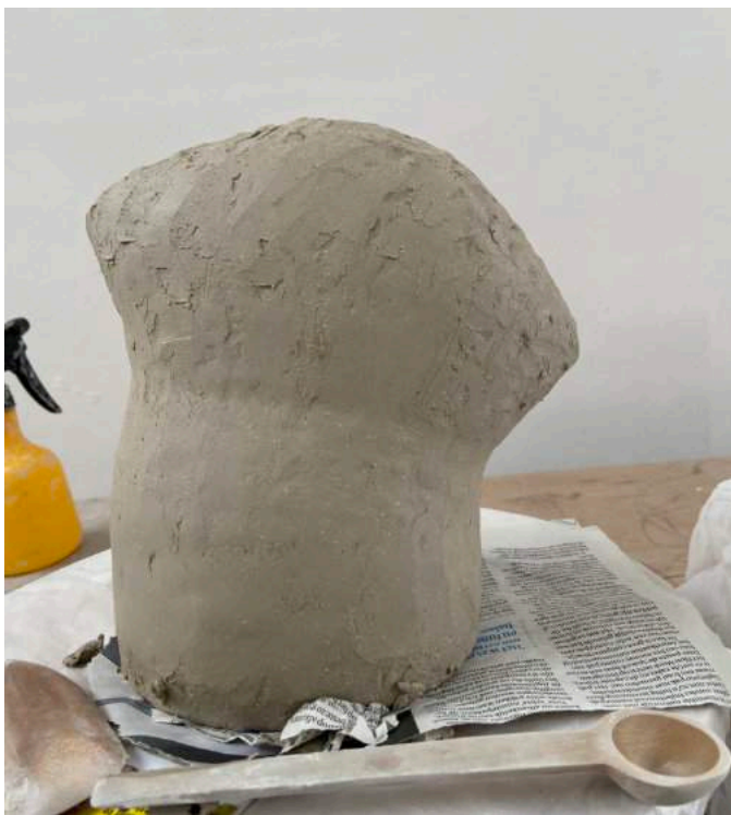
Dag 1: Ik begin zonder te weten waar ik naartoe ga – een reis zonder landkaart. Aan het eind van de eerste dag lijkt de vorm nergens toe te leiden.