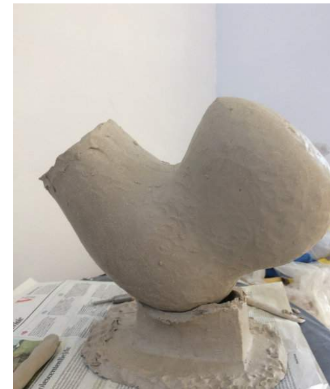
Ik bekijk de andere helft van het in tweeën gehakte werk, daarbij de rechthoekige doos gebruikend als steun.