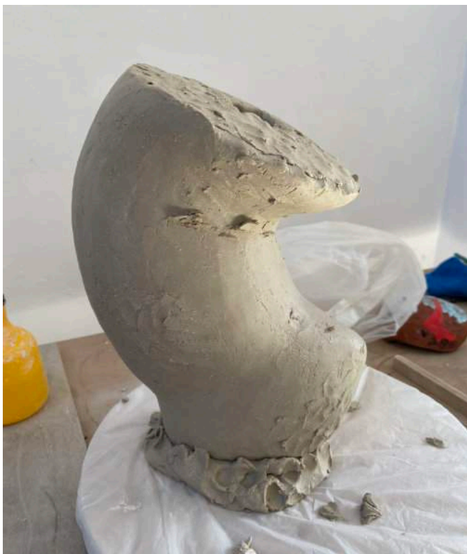
Dag 3: Ik sluit de bovenkant af met een plat vlak – maar het geheel vindt geen mooie balans en het platte vlak is te groot in verhouding tot de totale vorm.