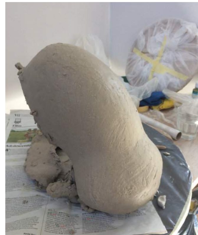
Opnieuw kom ik nergens uit – een doodlopend pad.