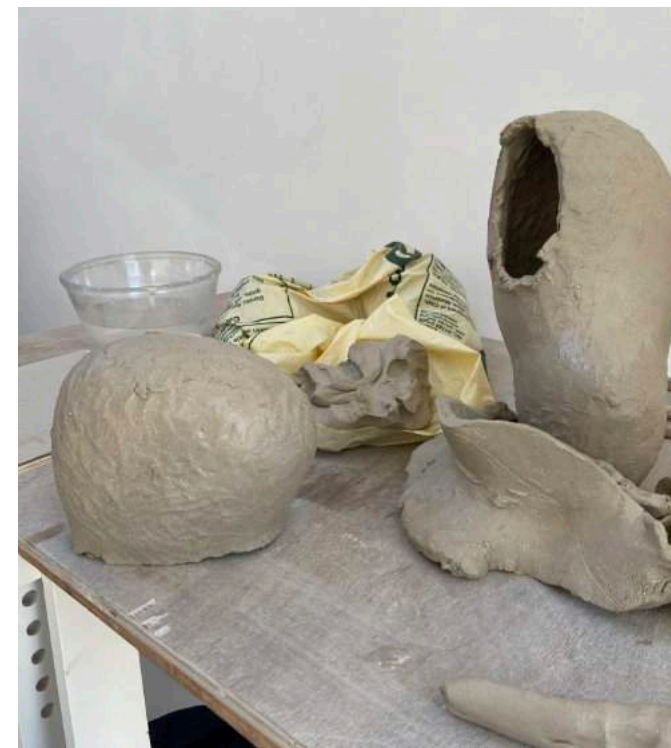
Dag 4: Ik hak het werk in tweeën...