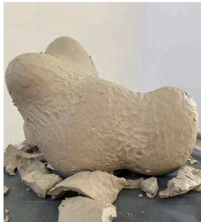
Aan het eind van de vijfde – en ook de volgende – dag weet ik helemaal niet meer waarnaar ik op weg ben en overweeg zelfs het op te geven...