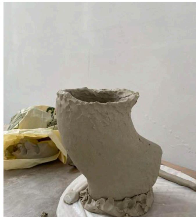
Dag 2: Ik zet de vorm op zijn kop.