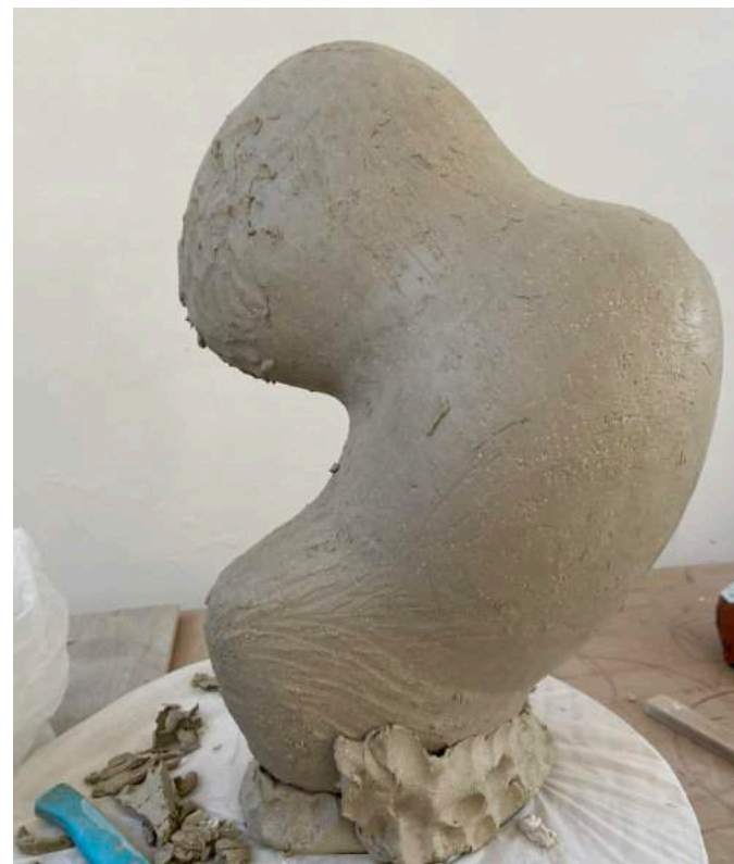
Ik volg mijn handen die de bovenkant samendrukken, waardoor een ovale vorm ontstaat. De vorm is prima, maar het object komt niet tot leven en het lijkt ook teveel op een eerder werk.