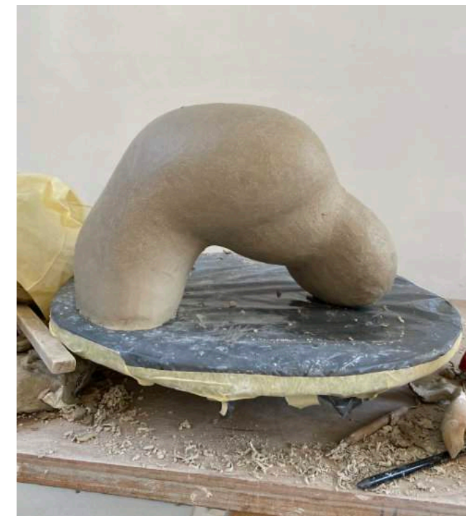
4 PM: De vorm lijkt eindelijk te kloppen – het werk lijkt zijn eigen logica te hebben gekregen...