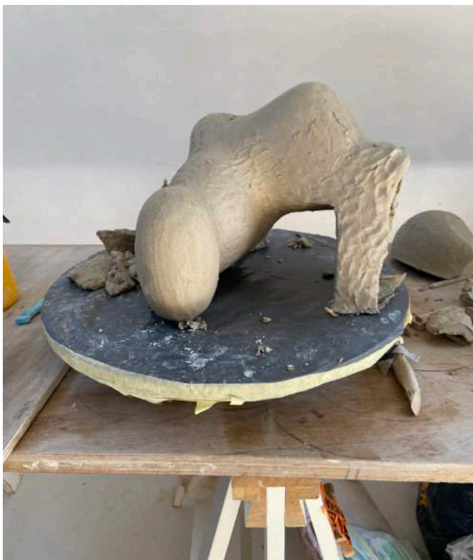
Dag 7: Ik besluit niet langer te proberen de zachtheid van de ronde vorm te benadrukken en trek de haakse arm eraf. Ik sta de vorm toe om zichzelf te zijn en maak het werk af zoals het zelf lijkt te willen – meer kan ik niet doen...